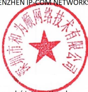
Zhou Jun Responsable des ventes du marché internationales